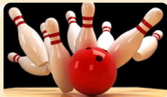
GAME ON באולינג ומתחם ארקיד + משחקי וידאו