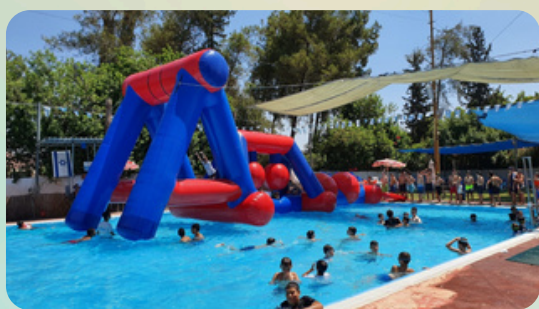
כיף של אתגרים משחקי אתגר ותנועה