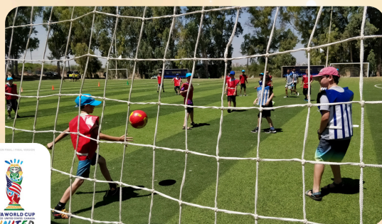
אלופים במים משחקי אולימפיאדה ומונדיאל