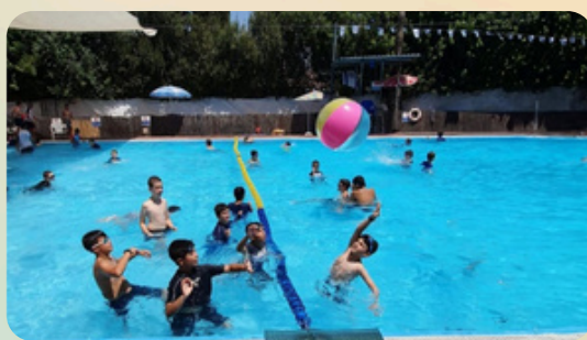
כיף מכל הכיוונים בריכה וסדנאות חוויה