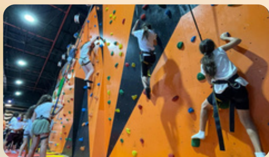
פסטיבל הספורט של ישראל בכפר המכביה מתחם גיימינג/קיר טיפוס