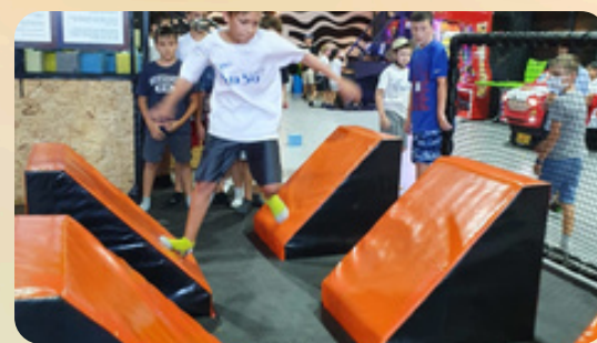
עפים באוויר נינג'ה סטאר פארק הטרמפולינות