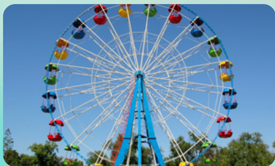
כיף בשיא הגובה לונה פארק תל אביב